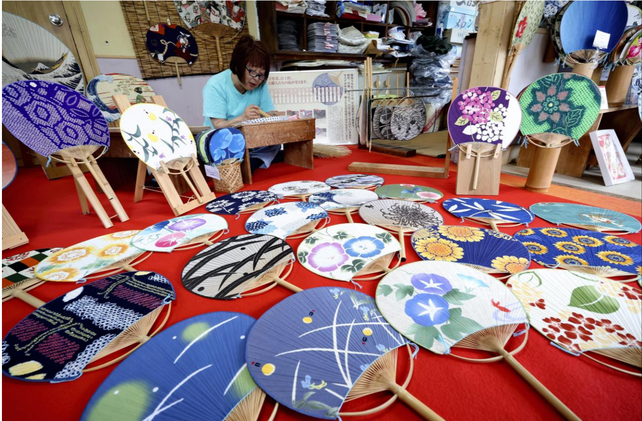
(2026年5月30日 読売新聞夕刊より)