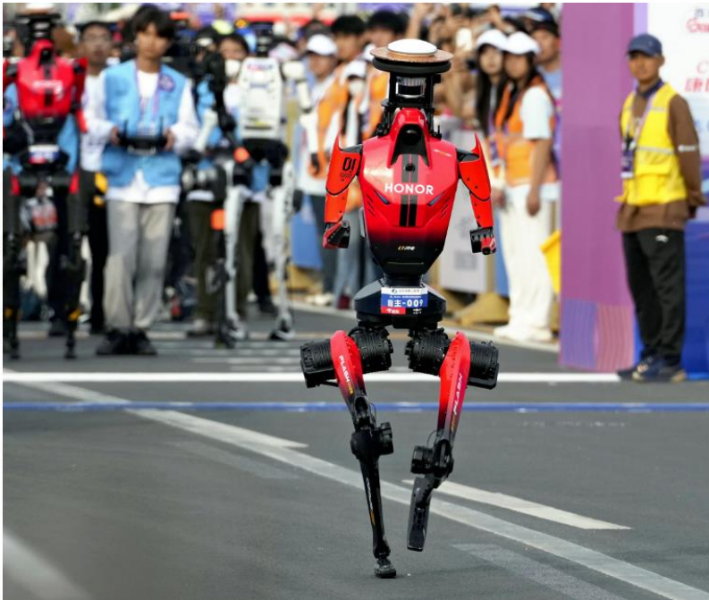
北京で開催されたハーフマラソン大会で優勝した人型ロボット（19日）