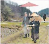
田の神様に感謝する石川県・奥能登の伝統行事「あえのこと」

後世に伝えるべき伝統芸能や祭り、工芸技術といった「形のないもの」を、ユネスコ（国連教育・科学・文化機関）が、保護する対象として登録している。登録数は世界で716件。日本からは「能楽」や「歌舞伎」といった伝統芸能や、「和食」、「伝統的酒造り」など23件が登録されている。建築や豊かな自然など形のあるものは「世界遺産」として登録される。