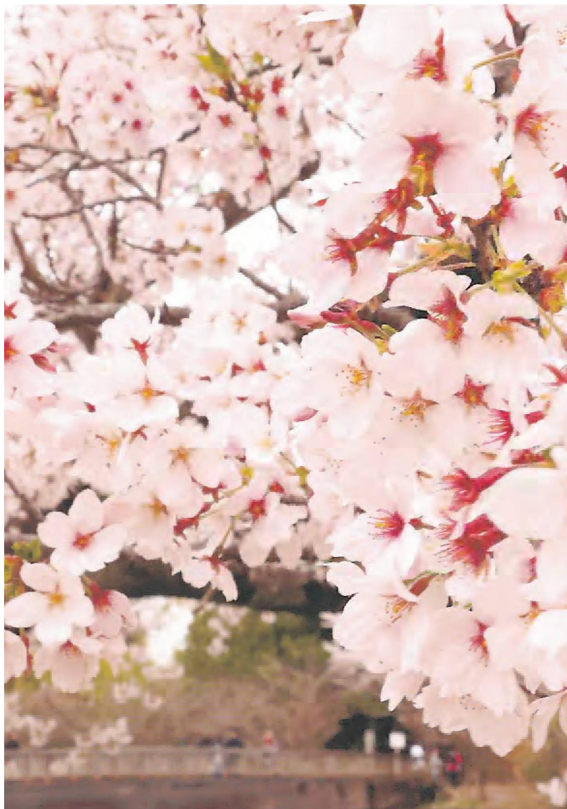
満開を迎えた桜並木（1日、つくばみらい市で）

つくばみらい市の福岡堰の桜並木が見頃となった。市観光協会によると、1・8キロにわたり約450本が並び、3月31日に満開を迎えた。天候次第では、水路が鏡のようになって桜が反