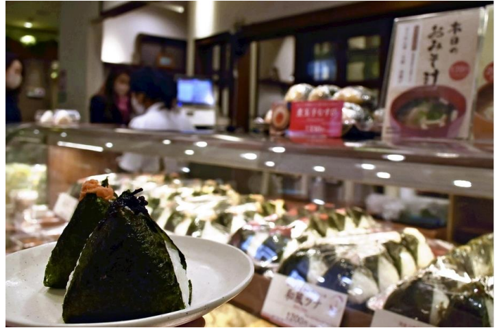
The surge in nori prices is also causing the price of onigiri sold at convenience stores to increase.

Nori cultivation generally begins around October when the sea temperature falls. However, in recent years, seaweed farmers have