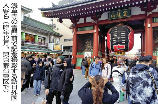
浅草寺の雷門前で記念撮影する訪日外国人客ら（昨年12月、東京都台東区）

向が大きく影響した。遅れていた新型コロナウイルス禍後の回復が年後半に進んだ。特に若年層や家族連れに日本への旅行人気が高く、30%増の約910万人となった。円安の影響で日本での宿泊や買い物が増え、中国に加えて欧米や豪州からの訪日客も増加し、22%増の約720万人となった。