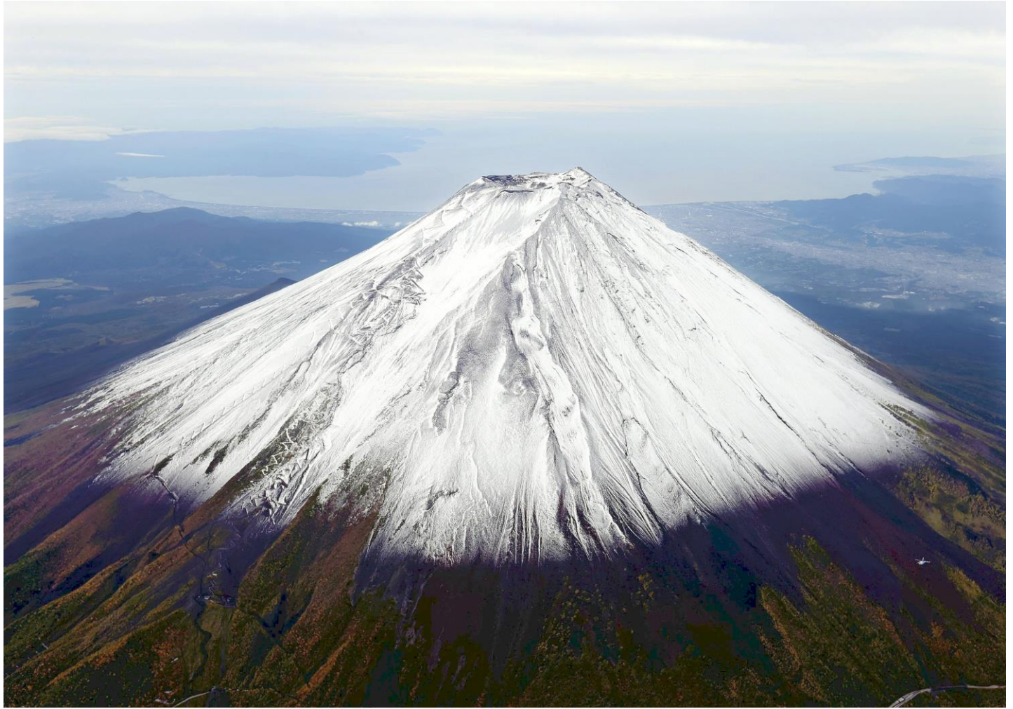
初冠雪を観測した富士山。奥は駿河湾（23日午前、本社ヘリから）

にほん いちばんたか やま こん き はじ ゆき さんちょう しろ み はつかんせつ かんそく ◆日本で一番高い山で今季初めて雪がつもり山頂が白く見える「初冠雪」が観測されました。