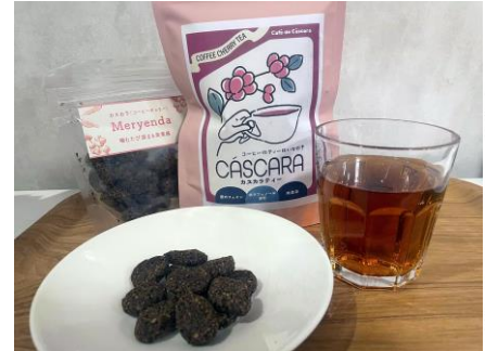
カスカラで作ったお茶(手前右)とクッキー(同左)

までに半減すると警鐘を鳴らしており、「2050年問題」と呼ばれる。全日本コーヒー協会によると、23年の日本でのコーヒー消費量は世界第4位。1人あたりの年間3・5キログラムほどのコーヒー豆を消費しており、国内での関心が高まっている。 現地の生産者らを支援し、生産者の利益につながるようとする活動もあり、コーヒー豆以外の部分「カスカラ」の活用が注目されている。コーヒー豆はコーヒーの実の種子にあたり、カスカラはその周りについている果肉や皮を総称するスペイン語だ。コーヒー豆を取り出す過程で廃棄されてきたという。 静岡文化芸術大(浜松市)