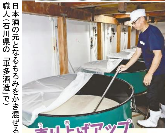
日本酒の元となるもろみをかき混ぜる職人(石川県の「車多酒造」で)