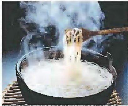
五島うどん

五島うどんは、小麦粉を練り、地元特産の「つばき油」を塗りながら、生地を引き延ばすのが特徴です。遣唐使が活躍した奈良・平安時代に、中国から作り方が伝わったという説があります。