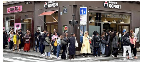
④パリの「おむすび権米衛」で人気の(左から)クルミみそ味、スパイシーチキン、玄米ごはんのサケおにぎり⑤店頭にはテイクアウトの順番待ちで長蛇の列