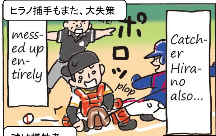
球は犠牲者を出した...