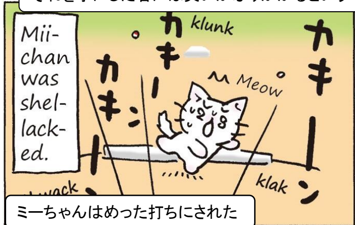
ミーちゃんはめった打ちにされた