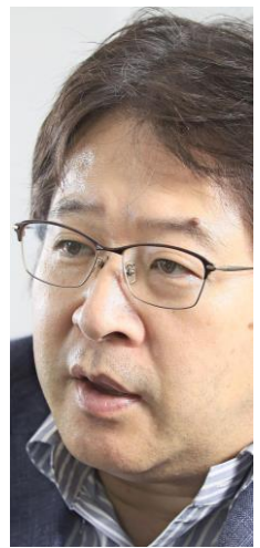
青山社中筆頭代表