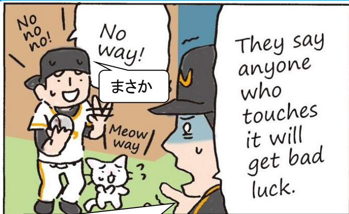
それを手にした者には災いがふりかかるという