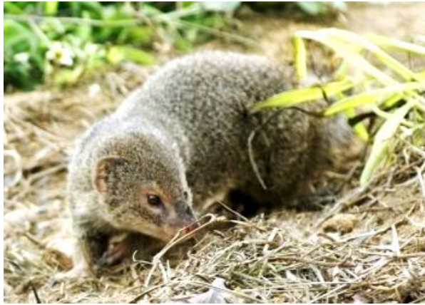
ファイリマングース

環境省は3日、鹿児島県奄美大島(約712平方キロ)で駆除を行ってきた特定外来生物の「ファイリマングース」について、根絶を宣言した。2018年4月を最後に捕獲されていないことから、有識者の検討会が同日、「根絶した可能性が非常に高い」と評価した。定着したマングースの根絶例としては、世界で最大規模という。