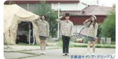
京畿道キャンプ・グリーンズ