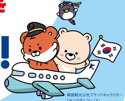
韓国観光公社ブランドキャラクター 「キングダムフレンズ」

韓国と日本は歴史や文化を通したつながりが深く、日本から50年以上も続く修学旅行受け入れの実績があります。 日本全国各地からのアクセスも豊富で安全性も高く、費用面での負担も少なく安心です。 学校交流や人気の文化体験、SDGsプログラムなど、その魅力はたくさん! 韓国観光公社が実施する支援制度を利用して、ぜひ韓国への修学旅行を実現させてください!