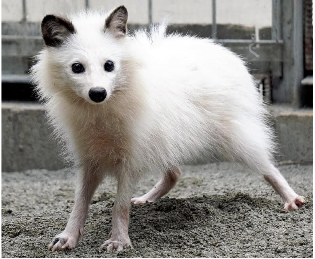
しろとり動物園で公開されている白いタヌキ(東かがわ市で)