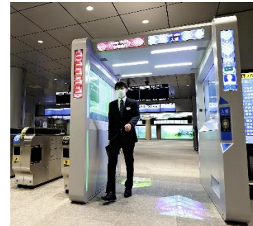
顔認証で通過できる改札。JR西日本が大阪駅に試験的につくった

体のいろいろな場所にある特徴が、人ならではの「特徴」があります。生体認証とは、こうした体の特徴を機械で読み取り、個人を特定する技術のこと。これまでは、買い物やスマホのロックを解除する時には、暗証番号やICカードなどを使っていました。しかし、番号を忘れたり、カードをなくしたりするトラブルが付きものでした。生体認証ならばこうしたトラブルはありません。偽造が難しいため、暗証番号やパスワードよりも悪用される危険性が低いのです。