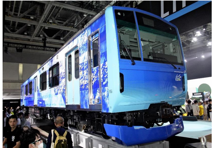
展示されたJR東日本の「ひばり」(4日、東京都江東区で)