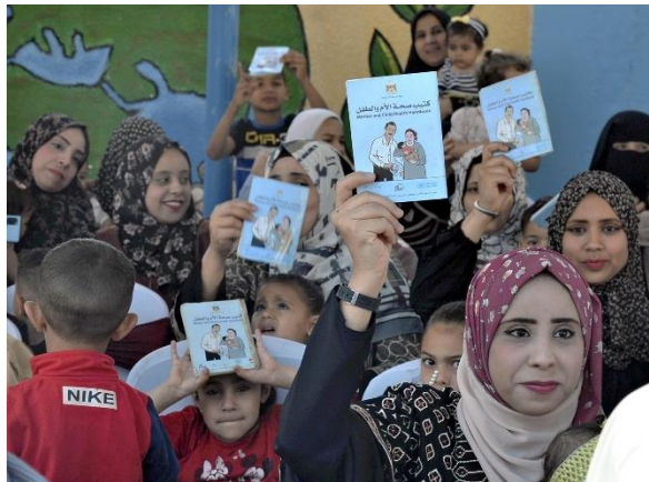
パレスチナ自治区ガザ南部ハンユニスで、日本発の母子手帳を掲げるパレスチナの女性たち(6日)

パレスチナで日本発の母子健康手帳が導入されて15年を迎えた。今では、ほぼ全てのパレスチナ人の母親が持ち、「命のパスポート」として母子の健康を守っている。記念式典が6日、ハンユニスの日本健康センターで開かれ、母親たちは手帳を手に感謝の意を示した。(パレスチナ自治区ガザ南部ハンユニス 福島利之)