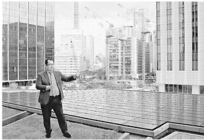
日産自動車のグローバル本社の屋上に設置された太陽光パネル（4月28日、横浜市で）