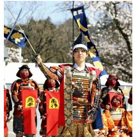
武者姿で臨んだ藤井聡太竜王