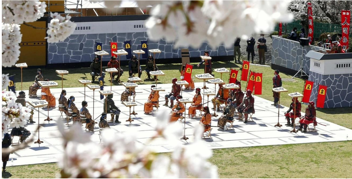
満開の桜に囲まれて行われた「人間将棋」

◆山形県で開かれた春の伝統行事。絢爛豪華な装いが来場者の目を楽しませました。 (2022年4月18日 読売新聞朝刊より)