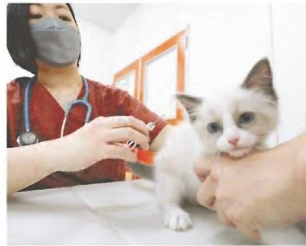
ペットショップの施設で獣医師にマイクロチップを装着される子猫（1月、東京都大田区で）

6月の改正動物愛護管理法の施行に伴い、ペットの犬や猫の販売前にマイクロチップ（写真）を埋め込み、所有者情報などを登録することが義務づけられる。飼い主の安易な飼育放棄を防いだり、迷子の犬猫を返還しやすくなり、殺処分を減らすのが狙いだ。 （中川慎之介、浜田喜将）