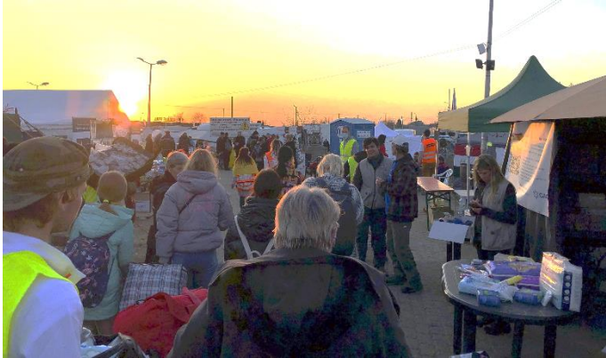
大きな荷物を持ってポーランドに避難してきたウクライナ人たち（3月24日、ポーランド・メティカで）