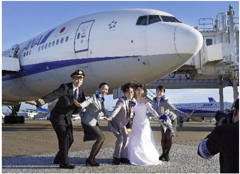
羽田空港に駐機した旅客機のすぐそばで記念撮影をする新郎新婦。機内での結婚式では機長が立会人を務め、参列者はビジネスクラスのシートから2人を祝福した。

【1】航空業界はなぜ、新サービスを始めたのですか。記事を読んで理由を書きましょう。