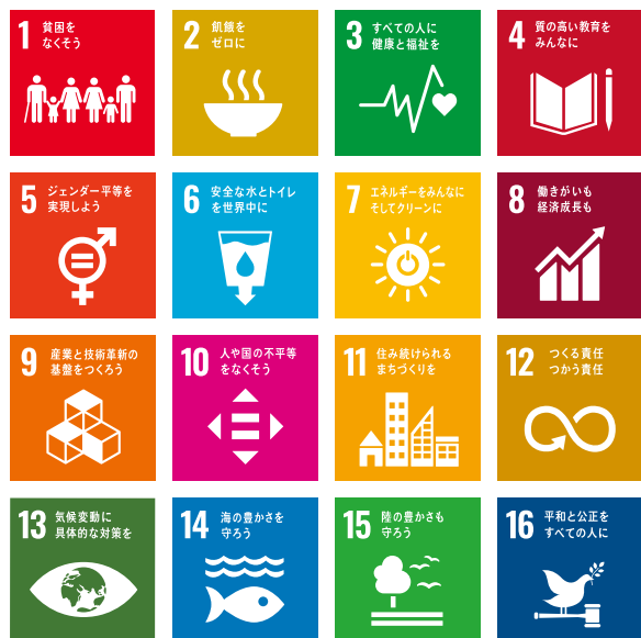
読売 KODOMO 新聞 (2019年7月25日) を一部加工

読売中高生新聞に、SDGsにまつわるコーナーが登場しました。その名も「読売中高生SDGs新聞」。毎月3週目に掲載し、全国の中学、高校の活動を紹介していきます。