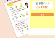
学習ノート 学習画面からダウンロードして、授業動画のポイントを書き込めます。