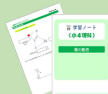
学習ノート 学習画面からダウンロードして、授業動画のポイントを書き込めます。 ※小3理科・社会、小4社会を除く。