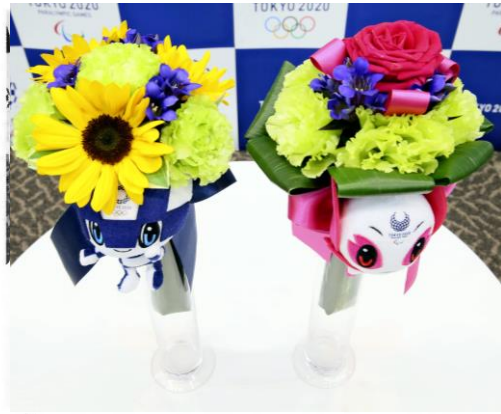
▲メダリストに授与されるブーケ